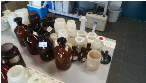
Vorbereitung der Proben

Außerdem gilt das Freiwillige Ökologische Jahr für viele Ausbildungsbetriebe als Praktikum und wird als Wartezeit für Studienplätze anerkannt.